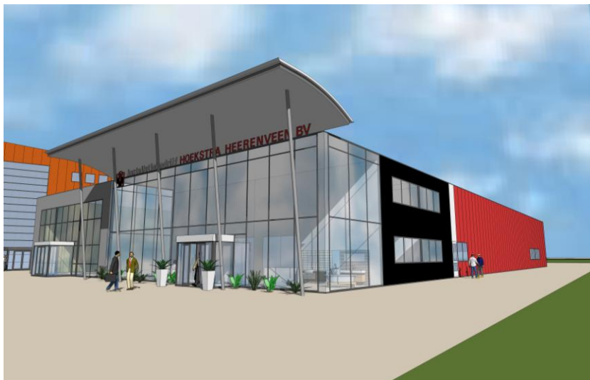
Het nieuwe bedrijfspand van Installatiebedrijf Hoekstra Mildam BV

Op 1 januari 2007 hopen wij ons op onze nieuwe locatie te vestigen. En natuurlijk hopen wij alle inwoners van Mildam bij de opening en in de toekomst te mogen begroeten. Iedereen is van harte welkom!