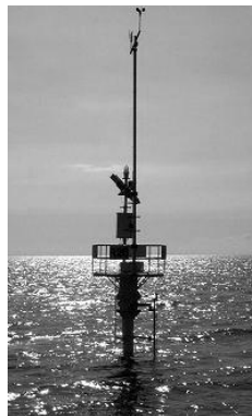
Foto: Golfmeetpaal van Rijkswaterstaat in het IJsselmeer

Toch zitten er mensen van Rijkswaterstaat te wachten op zo'n storm. Zij willen graag de golfslag meten die er dan in het IJsselmeer zal staan en waartegen de dijken van het IJsselmeer bestand moeten zijn. In 1997 is Rijkswaterstaat begonnen met een meetcampagne.