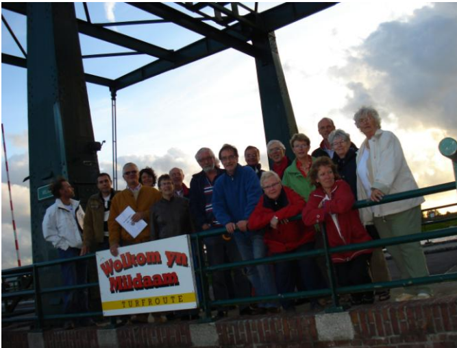
Leden van de vier werkgroepen van de Dorpsvisie

Er konden al projecten ingediend worden die snel gerealiseerd kunnen worden. We hebben voorgesteld een aantal parkeerplaatsen bij het kerkje te realiseren. Daar is het nu één grote modderpoel.