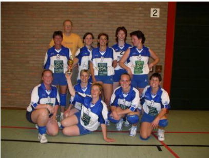
Het eerste damesteam van Mildam

Bij de senioren heeft Mildam helaas afscheid moeten nemen van zowel de heren als de recreanten. We hopen beide afdelingen komende periode nieuw leven in te blazen.