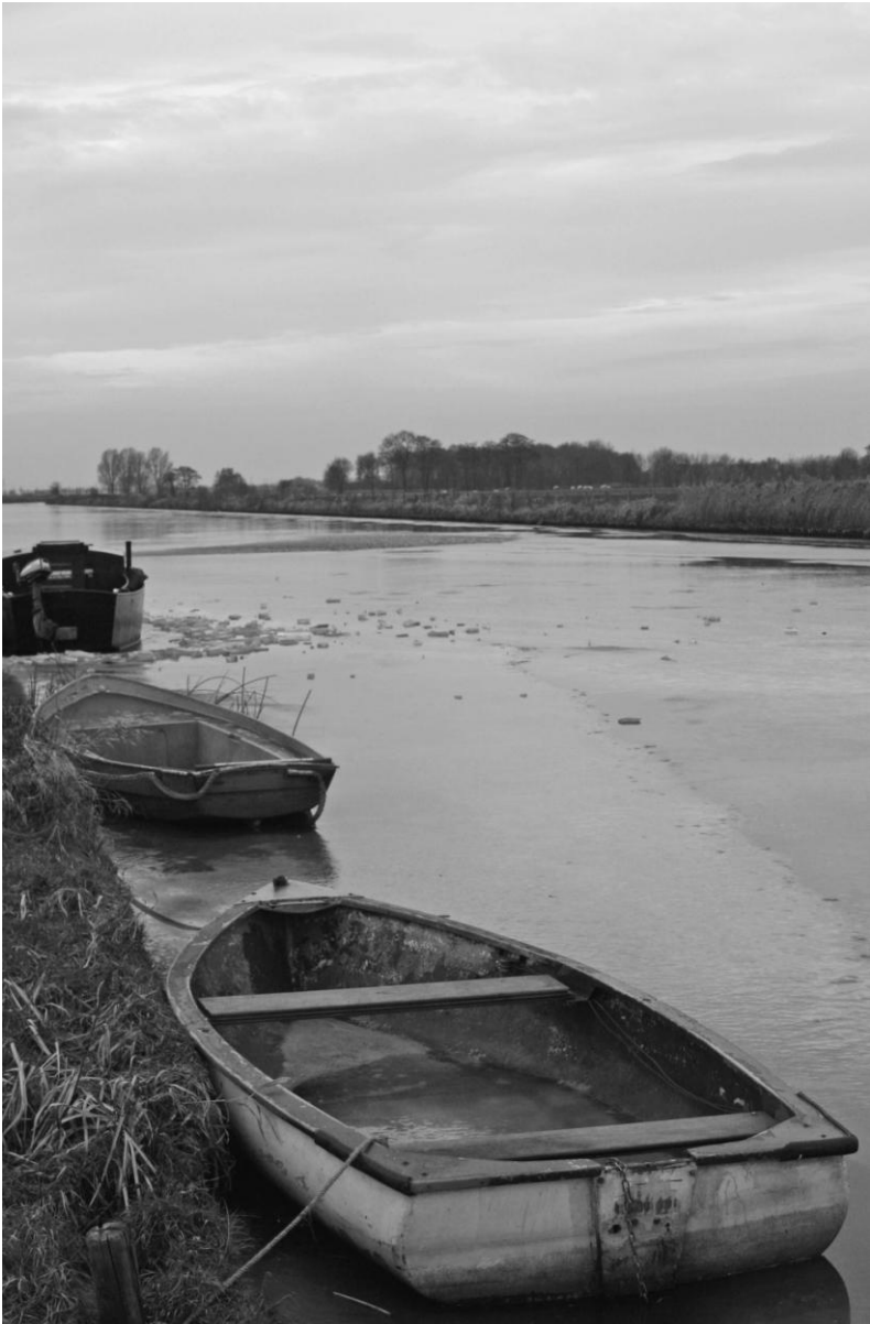
Een winters tafereeltje van onze huisfotograaf Sietse van Dijk.