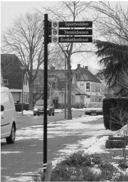
Nieuwe routeborden in Mildam (met het wapen van Mildam)