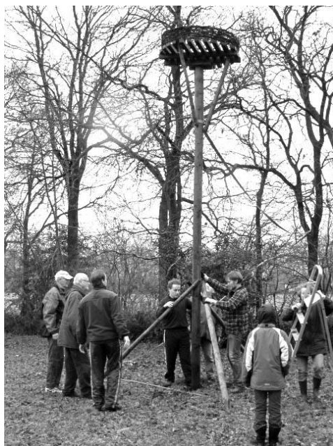
Daar staat hij dan. De paal moet nog wel even worden geschoord.