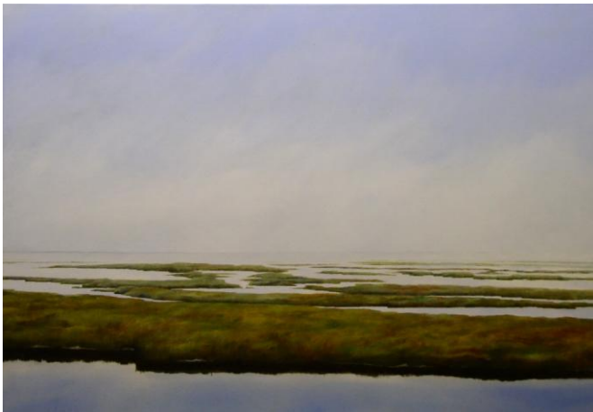
'De andere kant van Ameland'

Openingstijden It Alde Tsjerkje: wo t/m za 14.00 – 17.00 uur.