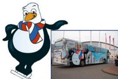
Cool Schaatsen op de warmste ijsbaan ter wereld

In Friesland hebben de instanties die actief zijn op kunstijsbaan Thialf: Schaatsschool Pro Action, Sport Impuls Zuidwest Friesland, Thialf Heerenveen, vervoerder Arriva en sponsor Friso de handen ineengeslagen. Samen subsidiëren zij het vervoer en de schaatslessen voor leerlingen van basisscholen. Vorig schooljaar hebben onze leerlingen van groep 6, 7 en 8 hier voor het eerst aan deelgenomen.